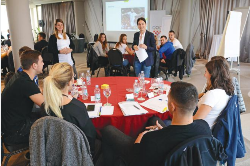
Slika 24 i 25: radionica za sportaše u organizaciji HOA-e i MOO-a u hotelu Panorama 2019.