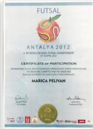
Slika 18 i 19: Svjetsko školsko prvenstvo, Antalija, 2012., nogometaši - fair play ekipa, diploma (izvor iz prezentacije škole na radionici „Sinergija“)