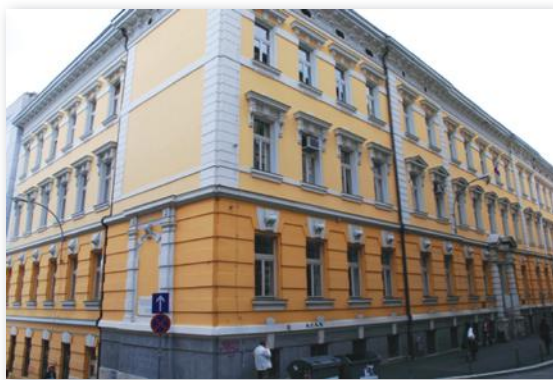
slika 16: PRHG (mrežna stranica škole)

„U školskoj godini 1997./1998. prvi put su upisani učenici koji se bave sportom i imaju status vrhunskog sportaša u zasebno odjeljenje. Plan i program rada učenika sportskih odjeljenja je po programu opće gimnazije, ali je način rada prilagođen potrebama učenika. U školskoj