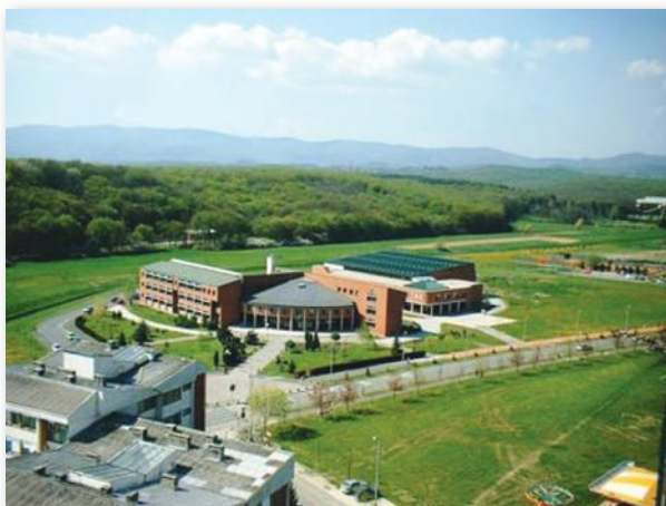
Slika 17: Gimnazija Sesvete (iz prezentacije i mrežne stranice škole)