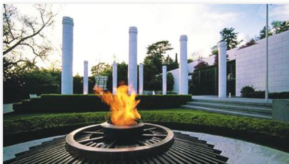
Slika 4: Olimpijski muzej u Lausanni

Spomenik je postavljen i svečano otkriven 29. travnja 1995. godine. U podnožju spomenika je natpis: „Dražen Petrović – košarkaš Hrvatske, Vasko Lipovac kipar, dar Hrvatskog olimpijskog odbora Međunarodnom olimpijskom odboru“.