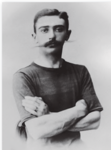
Slika 7: Barun Pierre de Coubertin