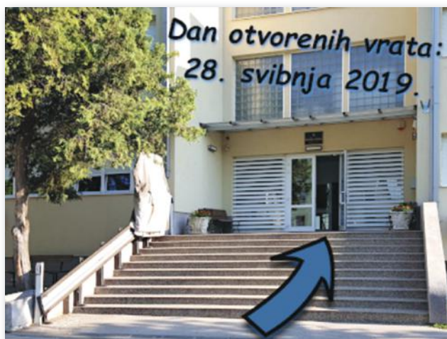
Slika 15: Športska gimnazija (mrežna stranica škole)

Učenici Športske gimnazije, Prve riječke hrvatske gimnazije i Gimnazije Sesvete u suradnji s nastavnicima pripremili su prezentacije o školi, školskome sportskom društvu i sportskim postignućima te o sportašima koji su bili učenici škole.