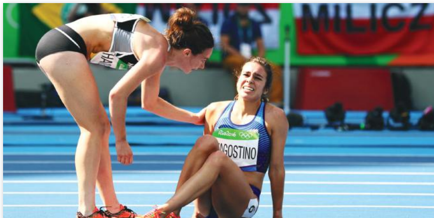
Slika 8: Fair play na terenu

Prve moderne OI održane su u Ateni 1896. godine. U odnosu na antičke OI, moderne OI imaju svjetovni karakter, organiziraju se u čitavom svijetu, traju znatno duže (do 16 dana), sudjeluju sportaši iz cijelog svijeta. Na OI od 1900. sudjeluju žene, a od 1924. godine organiziraju se Zimske olimpijske igre (ZOI).