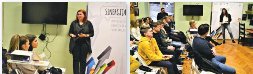
Slika 20 i 21: ambasadorice dual karijere u razgovoru s učenicima-sportašima na radionici „Sinergija“