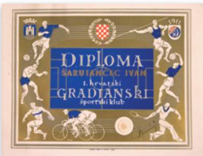
Slika 3: diploma iz postava HŠM-a

Osim Hrvatskoga športskog muzeja, građu o tjelovježbi i sportu kraja i/ili regije nalazi se u općim, zavičajnim i drugim muzejima u Hrvatskoj. Specijalizirane institucije muzejskog tipa u Hrvatskoj koje prikupljaju i čuvaju sportsku građu, osim Hrvatskoga športskog muzeja jesu: Muzejsko-memorijalni centar Dražen Petrović, Kuća slave splitskog športa, Samoborski muzej, Zavičajni muzej Ogulin, Muzej planinarstva Ivanec, zbirke različitih muzeja koje nisu većinski sportske, ali imaju i sportsku građu. Osim u Zagrebu, sportski muzej možemo posjetiti u Ljubljani, Budimpešti, Beogradu, Sarajevu, Varšavi i drugim velikim gradovima. U sklopu radionice prikazan je film o kiparu Vasku Lipovcu koji je izradio spomenik Draženu Petroviću koji se nalazi u Olimpijskom muzeju u Lausanni. Tadašnji predsjednik MOO-a Juan Antonio Samaranch predložio je da pred Olimpijskim muzejom u Lausanni, gdje su spomenici utemeljitelja modernoga olimpijskog pokreta barona Pierrea de