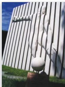
Slika 5: Spomenik Draženu Petroviću (iz prezentacije kustosa Marijana Sutlovića)