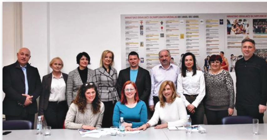
Slika 26: Komisija za dual karijeru u sportu Hrvatskoga olimpijskog odbora (osnivačka sjednica 17. veljače 2020.)