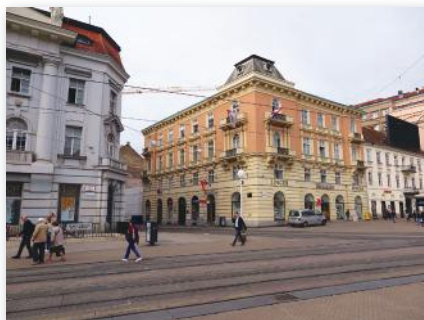
Slika 2: Hrvatski športski muzej, Praška ulica 2, Zagreb (info@sportski-muzej.hr)

Učenici i studenti mogu se obratiti muzeju kad im je potrebna sportska građa kao izvor za istraživanje, za izradu seminara, završnih ili diplomskim radova, za izložbu i sl.